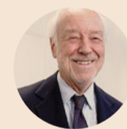
GIORGIO MARSIAJ Presidente dell'Unione Industriali di Torino

ta, dal titolo "Torino, spazio al futuro", con una serie di eventi promossi dall'Unione Industriali Torino nel corso dell'intero anno. Per il presidente degli industriali di Torino, Giorgio Marsiaj, «la proposta che abbiamo avanzato è espressione della volontà di guardare avanti, di esplorare le nuove frontiere dell'impresa, di anticipare le tendenze e le sfide del domani, attraverso un percorso che si propone di raccontare la storia, il presente e il futuro di Torino come città industriale, tecnologica e creativa». Una città che ha all'attivo diverse specializzazioni industriali, accanto all'automotive, e che punta a rafforzare la vocazione manifatturiera dei territori.